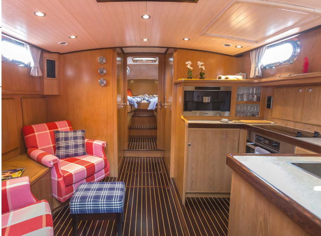
Alle luxe onderdeks voor twee opvarenden.